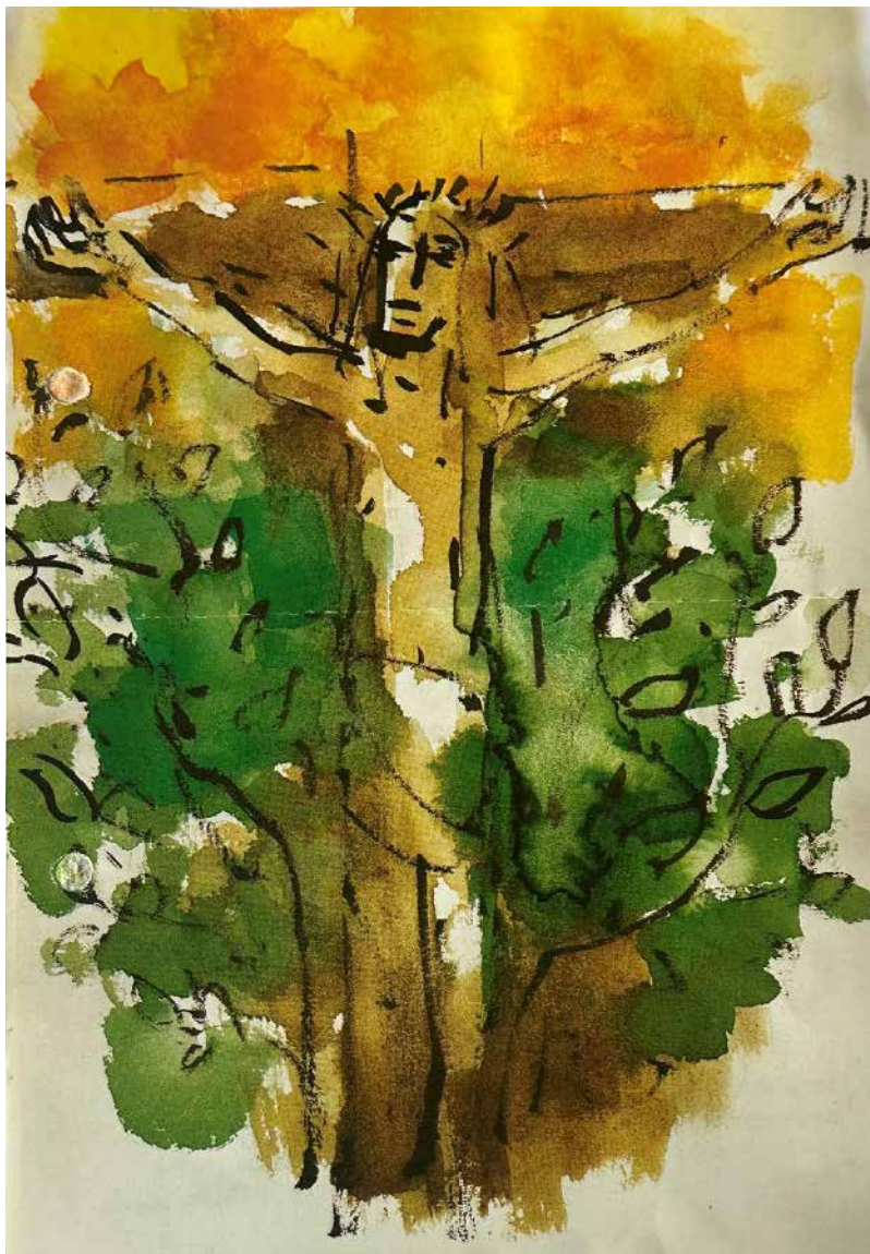
Maler: Horst Loreck