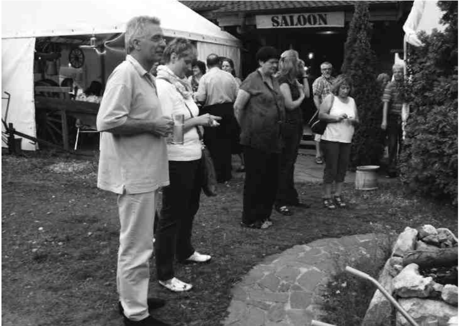
Ein Mitglied vom Betriebsfestausschusskomitee.

Wie bei allen Sitzungen nun halt mal so üblich, bildet sich immer wieder ein stahlharter Kern aus noch härterem Sitzfleisch. Wir können euch diese Ranch ohne Bedenken empfehlen. Schaut doch mal auf sein Anwesen unter: www.krollis-ranch.de rein. Fertig!